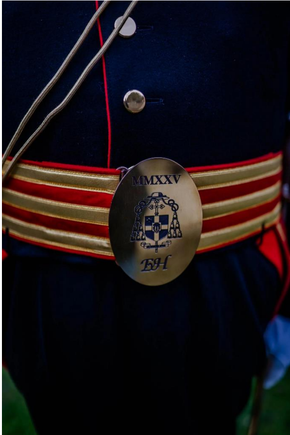
Het wapen van bisschop Ron van den Hout Valkenburg.

Voor zijn ceremoniële taken is natuurlijk een mooi uniform nodig. 'Ga bij schutterijen langs', kreeg de vervroegd gepensioneerde onderwijzman als advies. „Aardig idee, maar dit is wel wat buitenmaats”, glimlacht van Hooy, wijzend naar zijn bourgondische buik.