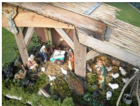
en nog 'n Kribke .....(Zonnedauw)