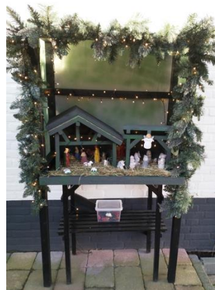
Kribke nr. 56