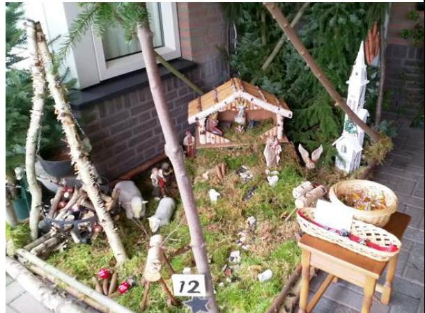
Kribke nr. 12