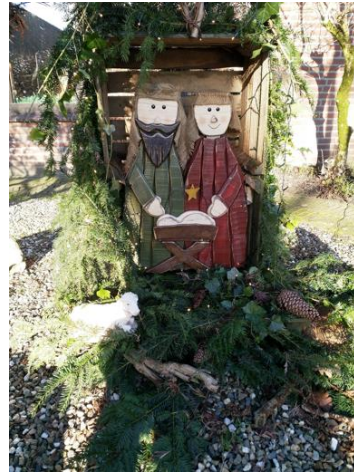
Kribke nr. 58