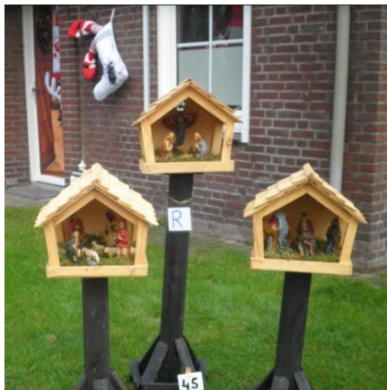
Kribke nr. 45