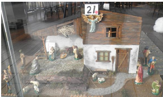
Kribke nr. 21