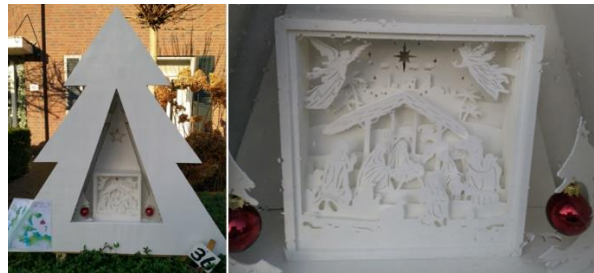
Kribke nr. 36