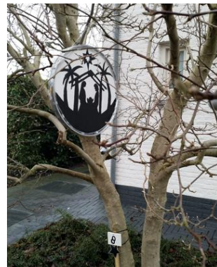
Kribke nr. 8