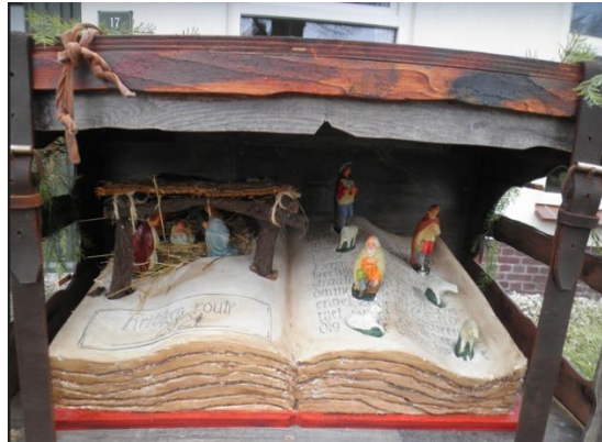
Kribke nr. 50