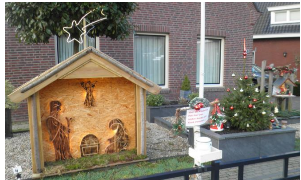
Kribke nr. 4