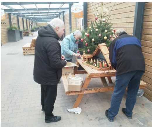
Kribke nr. 37