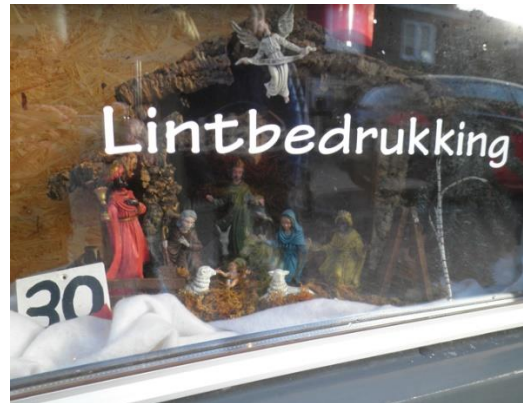
Kribke nr. 30