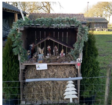
Kribke nr. 38