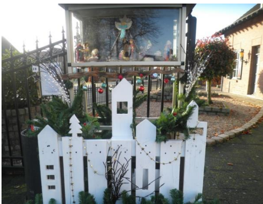
Kribke nr. 13