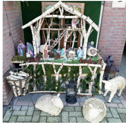
Kribke nr. 60