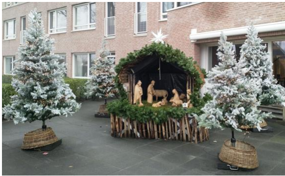
Kribke nr. 19