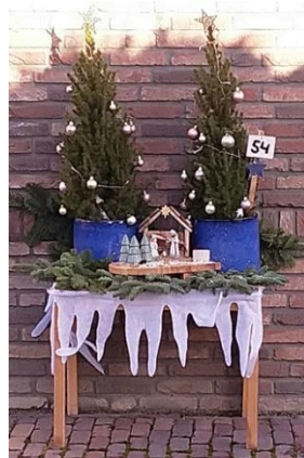
Kribke nr. 54