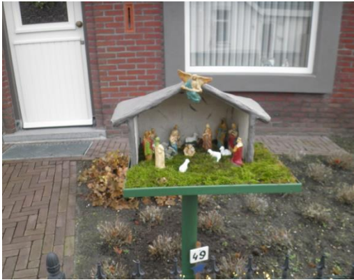
Kribke nr. 49