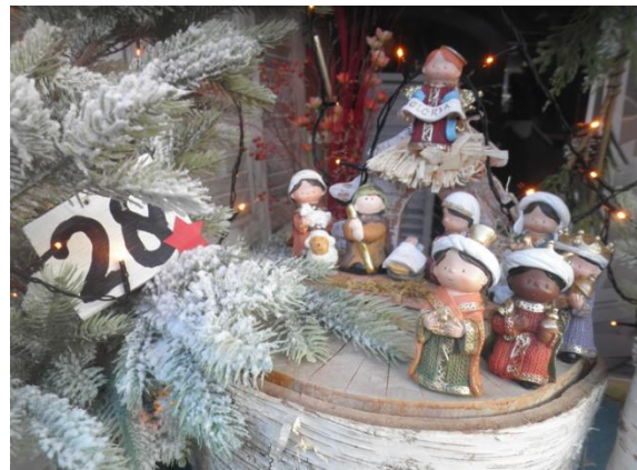
Kribke nr. 28