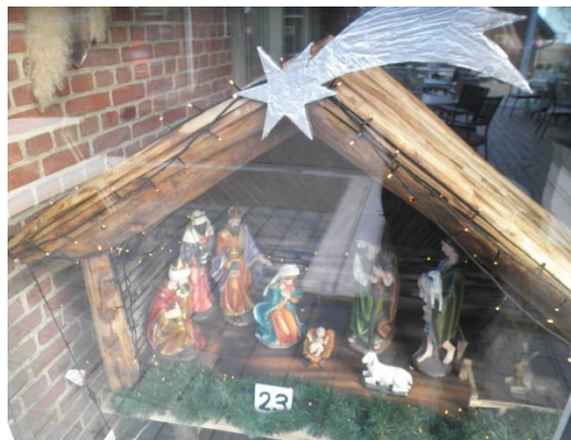
Kribke nr. 23