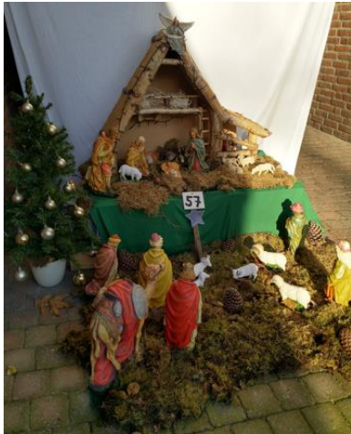
Kribke nr. 57