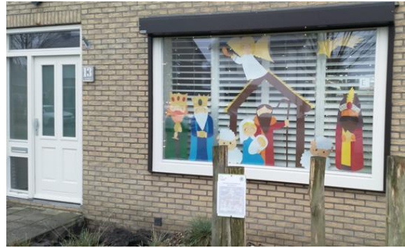
Kribke nr. 10