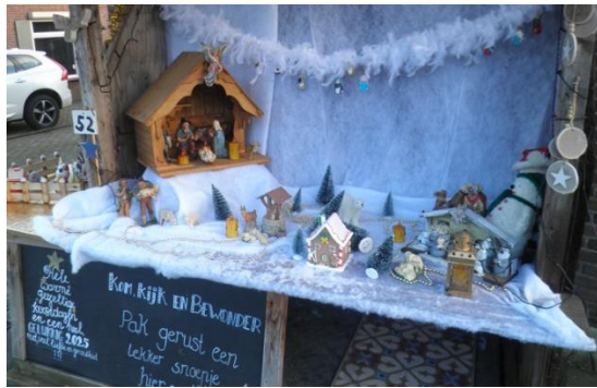
Kribke nr. 52