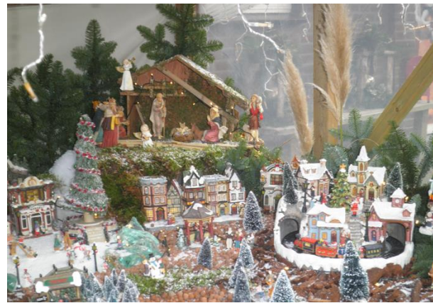
Kribke nr. 46