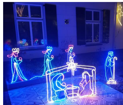
Kribke nr. 48