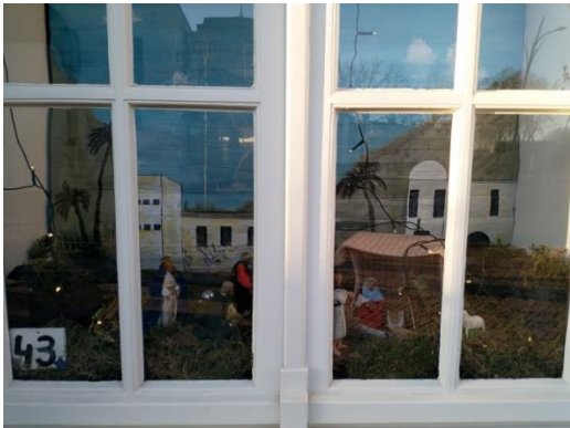
Kribke nr. 43