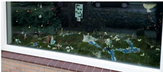
Kribke nr. 51