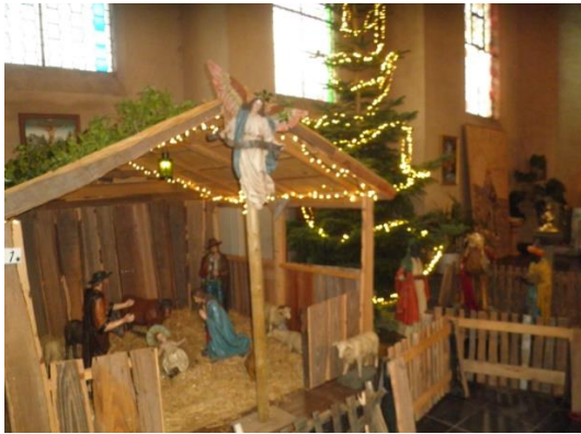
Kribke nr. 1

(hieronder de afbeeldingen van alle kribkes)