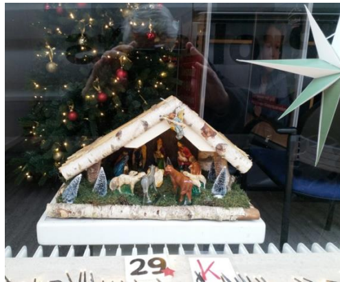
Kribke nr. 29