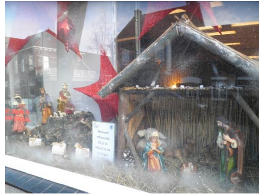
Kribke nr. 26