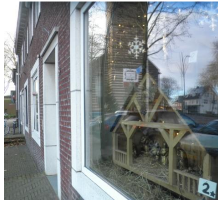
Kribke nr. 2