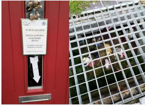
Kribke nr. 9