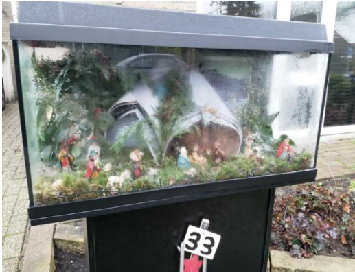
Kribke nr. 33