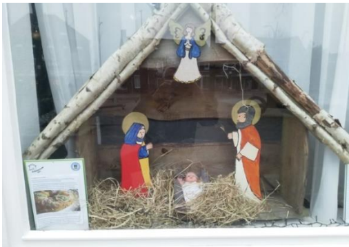
Kribke nr. 3