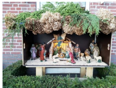
En.....dan nog eentje (Jan Truijenstraat)