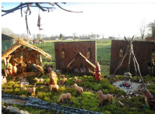
Kribke nr. 15