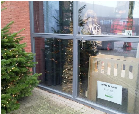
Kribke nr. 7