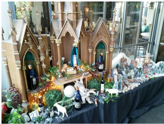
Kribke nr. 27