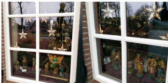
Kribke nr. 61