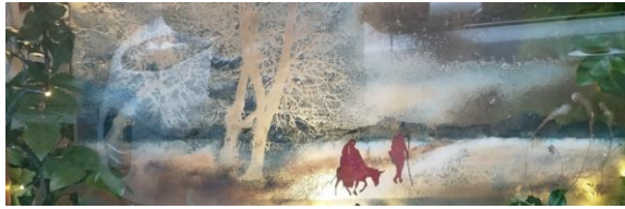
Kribke nr. 25