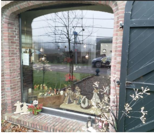
Kribke nr. 17