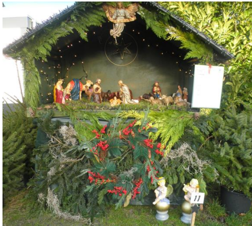
Kribke nr. 11