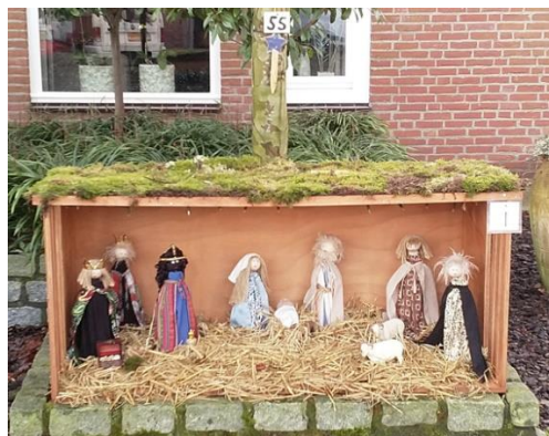
Kribke nr. 55