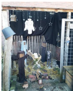
Kribke nr. 47