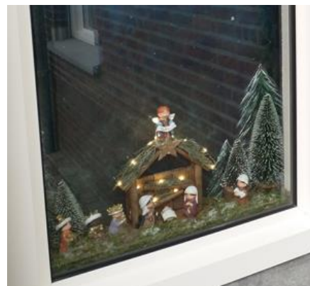
Kribke nr. 14