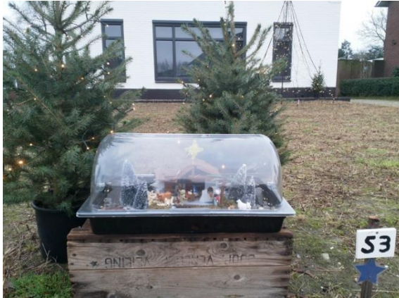
Kribke nr. 53