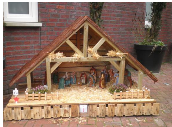
Kribke nr. 24