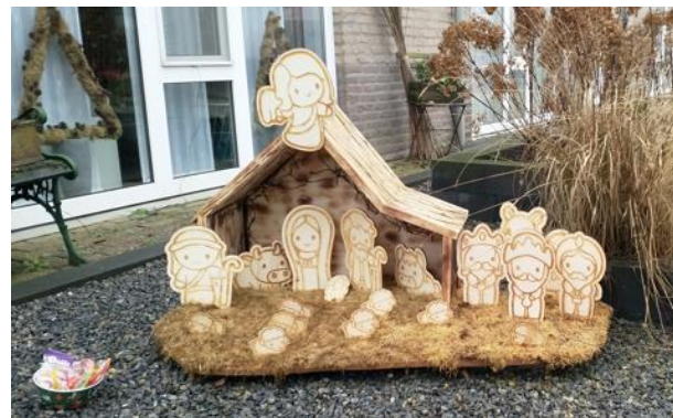
Kribke nr. 32