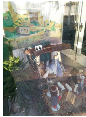
Kribke nr. 44