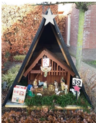
Kribke nr. 39