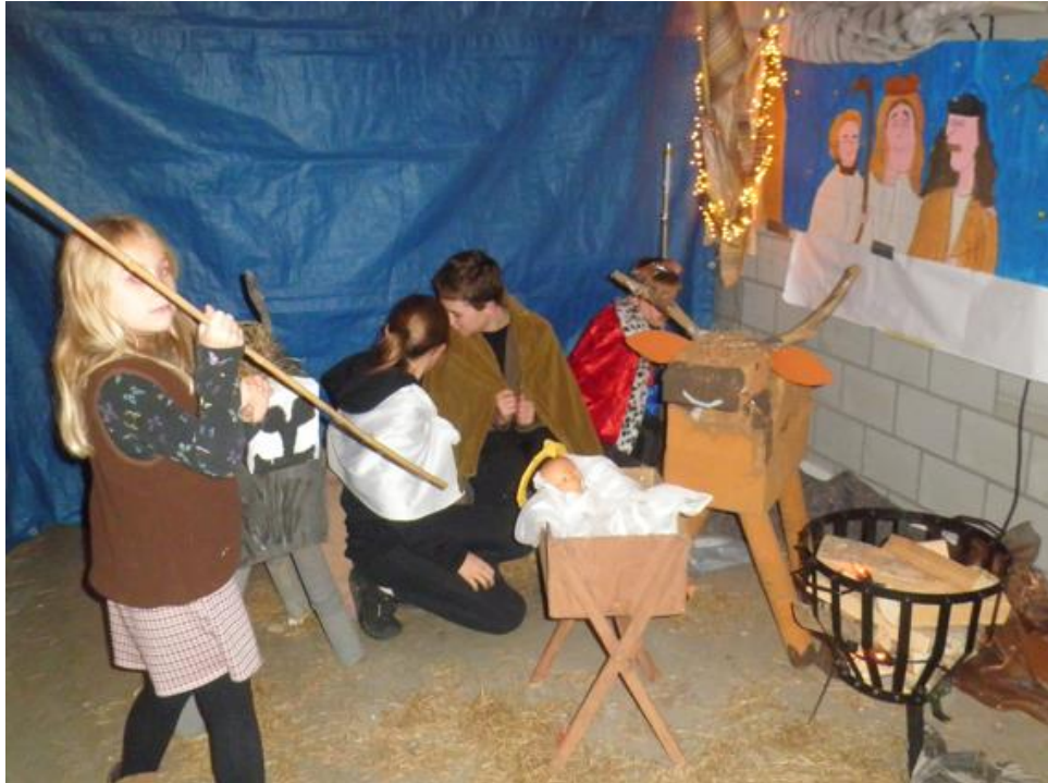
Levende Kerststal tijdens de Kerstmarkt van Kindcentrum Meijel op woe. 18 december