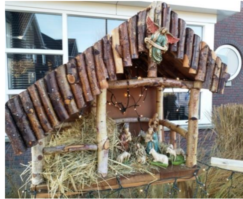
Kribke nr. 34