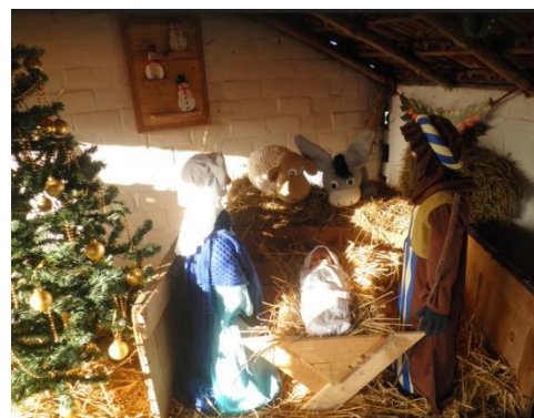
Kribke nr. 16