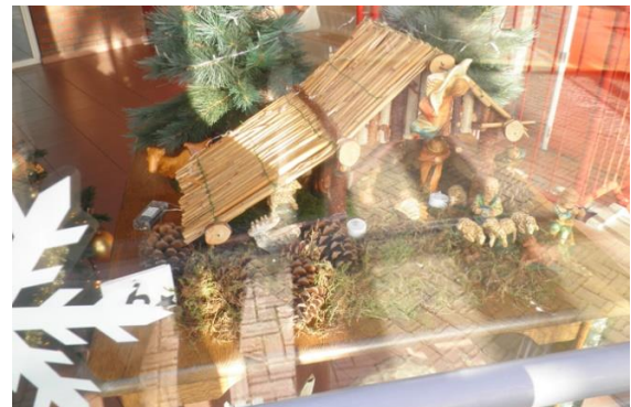
Kribke nr. 6