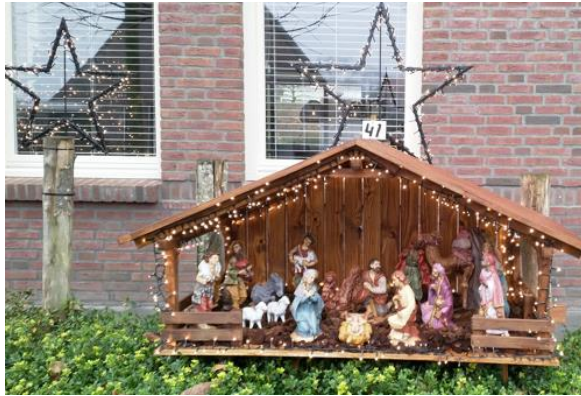
Kribke nr. 41