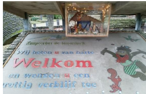
Kribke nr. 62