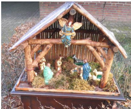
Kribke nr. 5