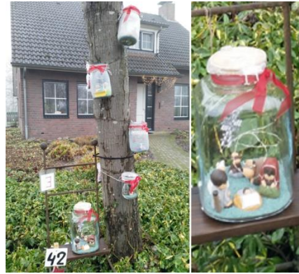
Kribke nr. 42