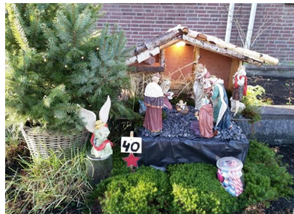
Kribke nr. 40