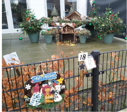
Kribke nr. 18