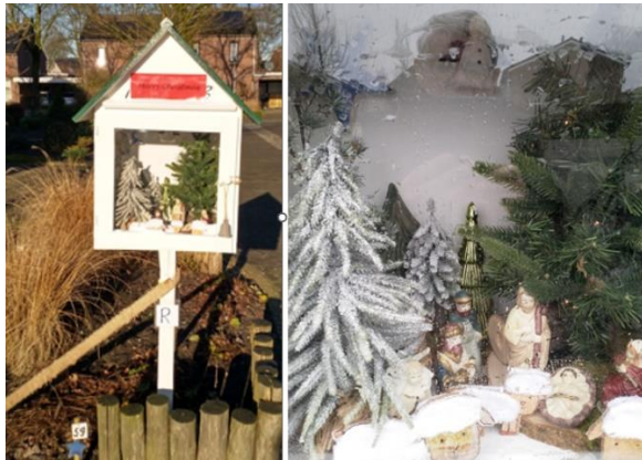
Kribke nr. 59