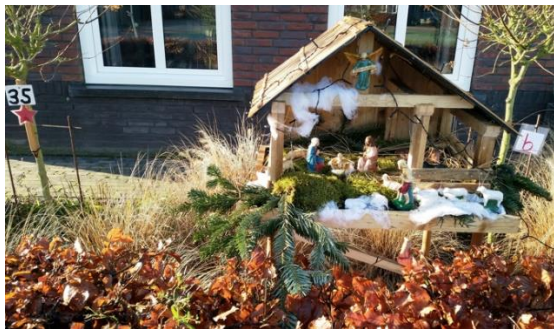
Kribke nr. 35