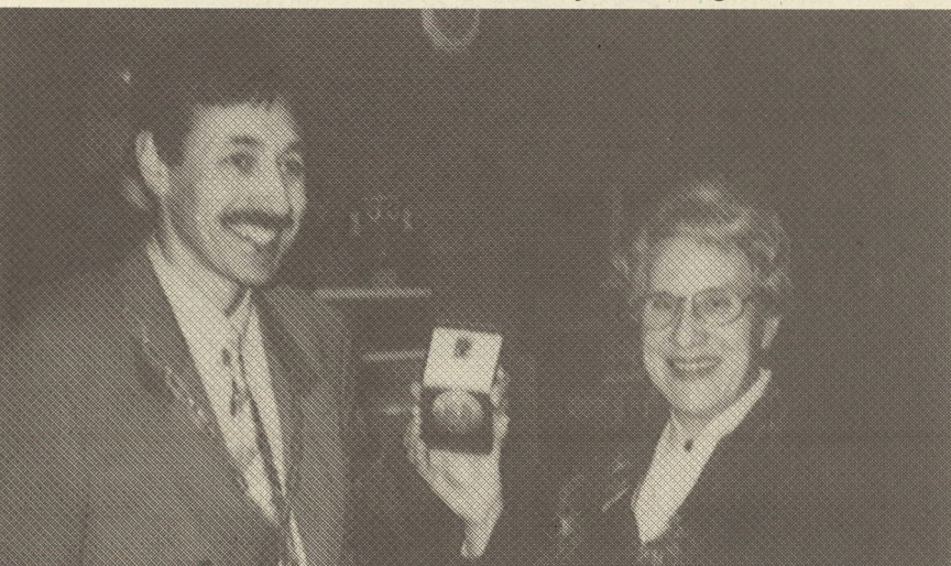
Gemeentelijke erepenning voor de Orde van de Zusters Franciscanessen.