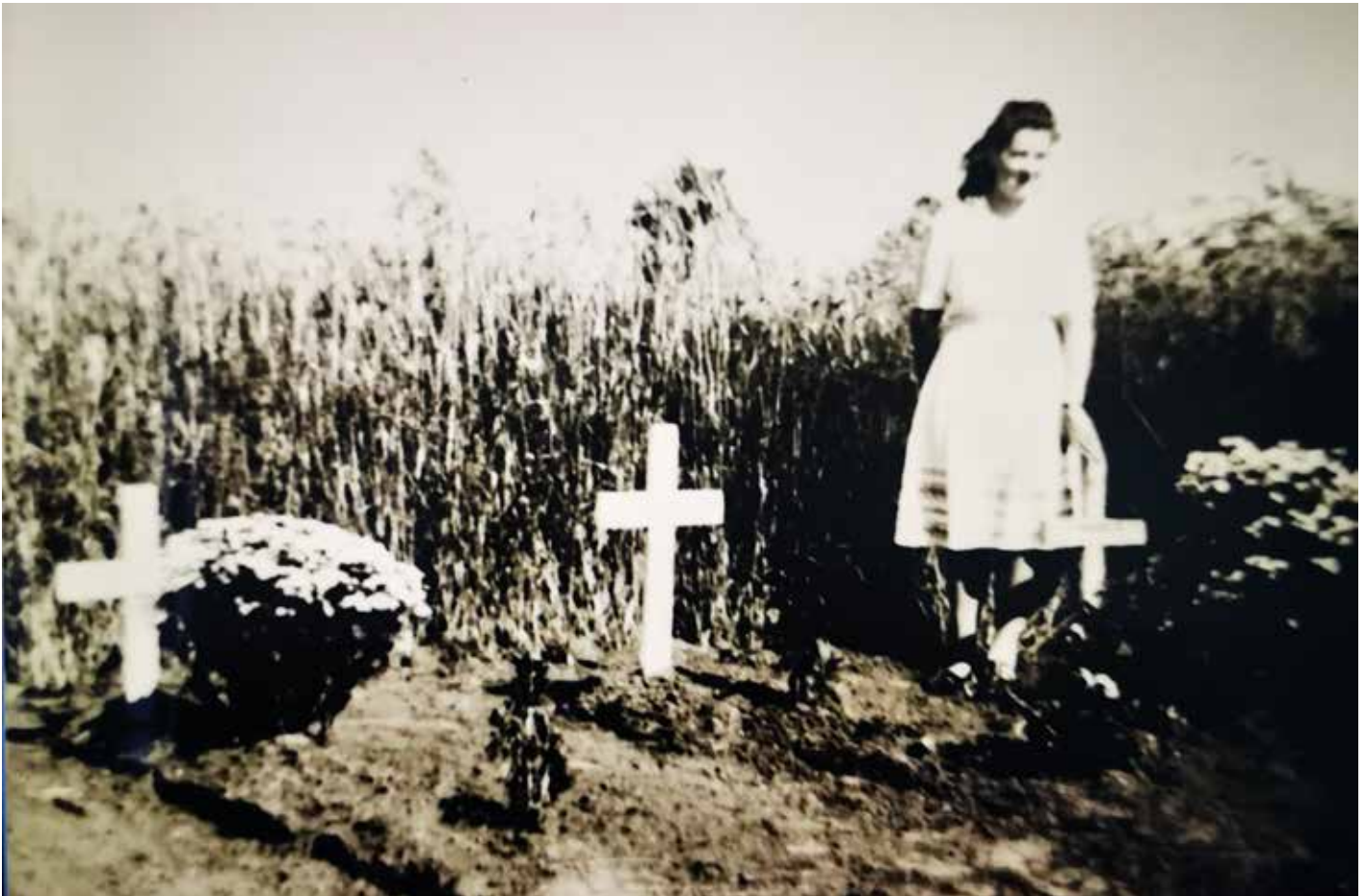
Afb. 2. Noodbegravingen tussen Meijel en Neerkant.

E en vrijwel vergeten maar prangende herinnering aan de felle gevechten – Meijel werd twee keer bevrijd – waren de tientallen veldgraven van gesneuvelde soldaten in en rondom het dorp. Hoewel soldaten hun doden gewoonlijk probeerden mee te nemen, was dit vanwege de onveilige situatie in de zuidelijke Peel niet mogelijk en werden veel dode militairen ter plekke begraven. Dat gebeurde in boomgaarden, langs boerderijen en burgerwoningen, gewoon langs de weg of midden in het open veld. Deze bijdrage gaat in op de vraag hoe het vergaan is met de Duitse noodgraven in en rond Meijel, meer specifiek over een Duitse begraafplaats die geheel uit de herinnering is verdwenen.