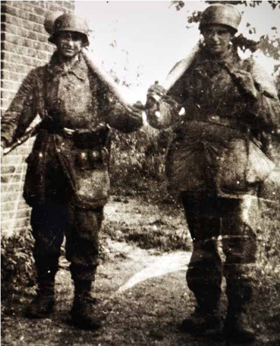
Afb. 3. Twee zwaarbewapende Duitse soldaten in de Meijelse Molenstraat. Ze zouden enkele uren later sneuvelen. Hun namen zijn onbekend. Mogelijk hebben beiden op het kerkhof aan de Astenseweg gelegen en rusten ze nu in Ysselsteyn.