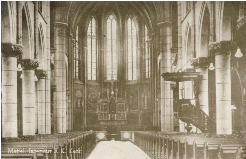
Meijel. Interieur R. K. Kerk